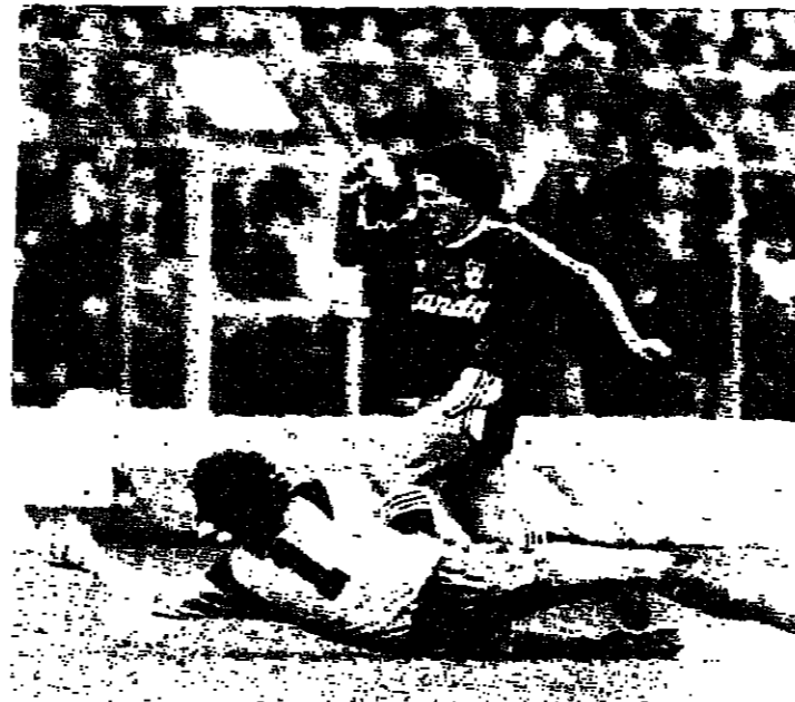
لقطة من مباراة ليفربول وشارلتون

السعالم ومنهم تشيركيسوف وتشيريكوف ورودينوف... العام ١٩٨٨ كطمت حجة مرجح